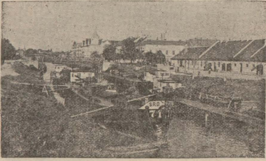
Alman kıt'alarının bulunduğu bildirilen Tamyardan bir görünüşü

Vichy 10 (A.A.) — Havas bildiri - Devlet reisi mareşal Petain, yeni bir savaş hakkında Fransaya hitaben yaptığı mesajında, evvelâ, Fransanın harbe sürüklenen rejimi tenkid etmiş ve yeni nizamın yabancı rejimlerin bir kopyası olmayacağını ve hatayın yeniden ardetine müsaade etmeyeceğini bildirdikten sonra harici siyaseti hakkında demiştir ki: