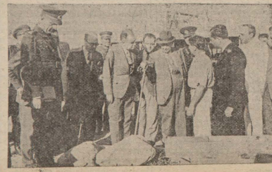
Hatayda fetkiklerde bulunan Başvekilin Ankara'ya döndüğünü dün yazmıştık. Yukarıdaki resimde Başvekil, Hatay petrol sahasında izahat